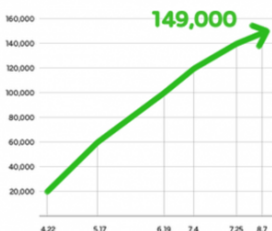
No. of Creators Registered